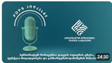
PDPS პოდეკასტი N11 - პერსონალურ მონაცემთა დაცვის ოფიცრის ცნება... 180 views · 4 months ago